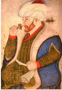
Mahomet (570 – 632)

Chef religieux, politique et militaire arabe de la tribu de Quraych. Fondateur de l'islam, il en est considéré comme le prophète majeur. Selon la tradition islamique, il serait né à La Mecque vers 570 et mort à Médine en 632.