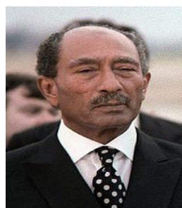
Anouar al Sadate (1918-1981) il occupe les fonctions de président de la République arabe d'Égypte de 1970 à son assassinat en 1981.