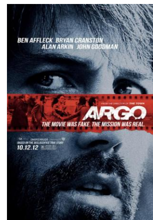
Argo, film de et avec Ben Affleck, 2012

Tiré de faits réels, Argo retrace l'histoire de la prise d'otages de l'ambassade américaine, et celle d'un agent de la CIA qui tente d'extraire des ressortissants américains menacés.